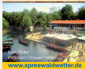
Live-Bilder Webcam Grosser Hafen

Dauer inkl. 3 Pausen: 6 bis 7 Stunden Tourenvorschlag: Individuell buchbar