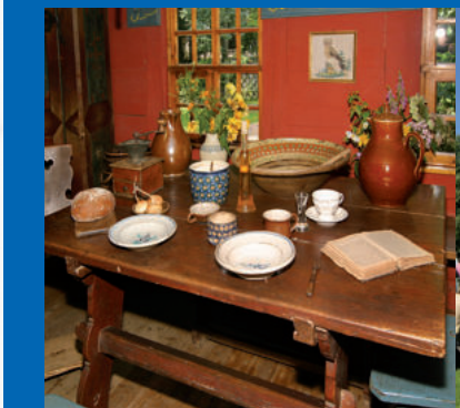
Freilandmuseum in Lehde