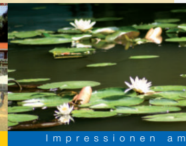
Impressionen am Ufer